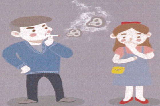
โรคปอดเรื้อรัง